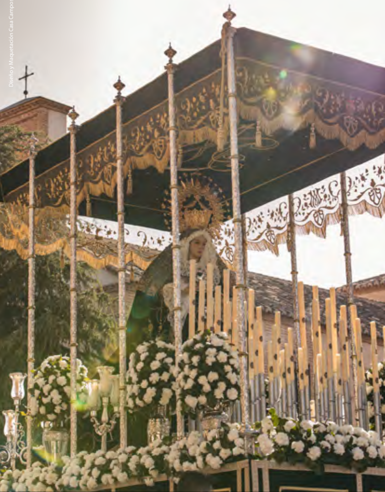
Nuestra Señora de la Soledad (Sábado Santo)