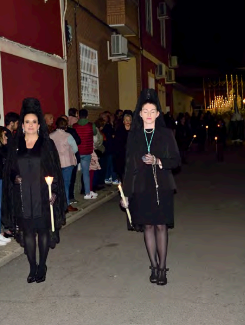
La elegancia de la tradicional mantilla española